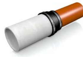
Push other plain ended pipe into adaptor coupling and tighten clamps.