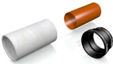
Position plain ended pipes.