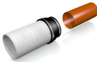
Slide adaptor coupling over one plain end.